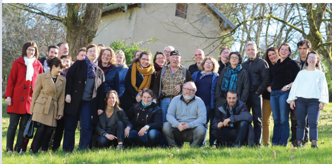
Un personnel formé et impliqué